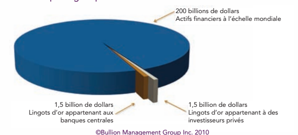
Graphique 3 : Comparaison de l'or et des actifs financiers Trop d'argent pour des réserves d'or insuffisantes

L'or reprend son statut de seule vraie monnaie, entrant directement en compétition avec le dollar américain. Heureusement, comme il est impossible de créer des lingots d'or du jour au lendemain, comme c'est le cas pour le papier-monnaie, l'or a pu conserver sa valeur pendant des milliers d'années. Tandis que la demande d'or s'intensifie, la production minière diminue depuis plus de 10 ans. À l'heure actuelle, la valeur totale des lingots en surface pour placement s'établit à 1,77 billion de dollars et elle est répartie entre les banques centrales et les investisseurs privés. En revanche, les actifs financiers mondiaux (actions et obligations) totalisent la somme colossale de 200 billions de dollars, voire plus. Comme l'illustre le graphique 3, l'or représente à peine 1 % du total des actifs financiers. Qu'arrivera-t-il lorsqu'une petite portion de ces actifs sur papier sera transférée vers les lingots dans une tentative de rééquilibrage? La seule manière logique d'assurer votre avenir financier est de détenir de véritables lingots de métaux précieux.